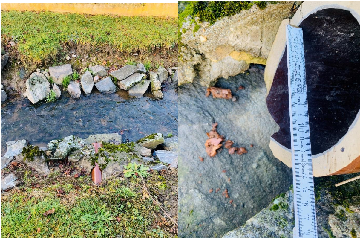
Obr. Kameninová výúst' č.3 DN 125