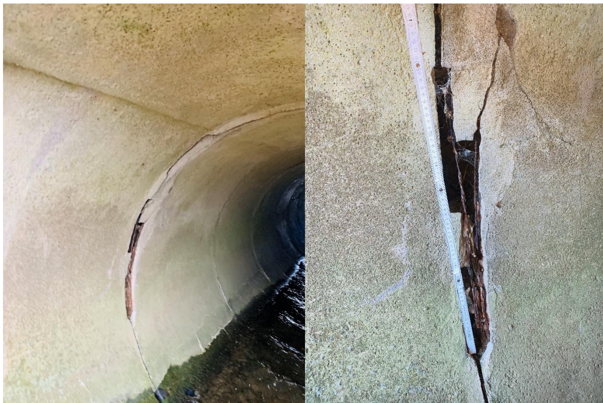
Obr. Praskliny v betonovém potrubí –navržena sanace.