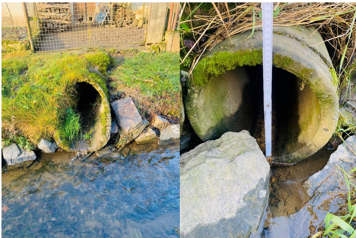
Obr. Betonová výúst' č. 6 DN 500 a výúst' č. 8 DN 300 přepad z tůně