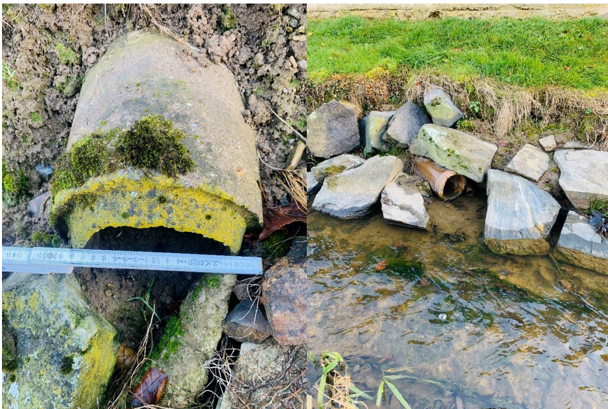
Obr. Betonová výúst' č.4 DN 150 a Kameninová výúst' č.5 DN 150