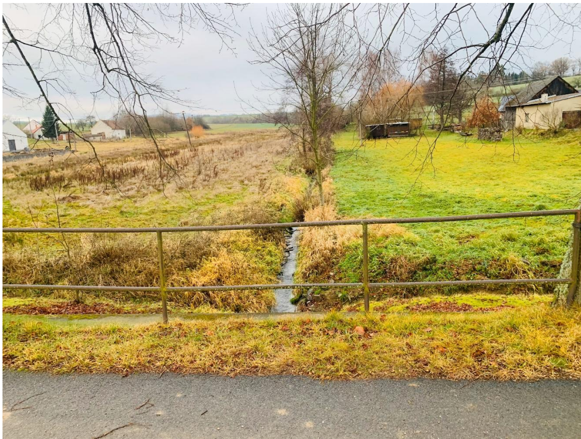
Obr. Celkový pohled na lokalitu – protiproudu nad propustkem