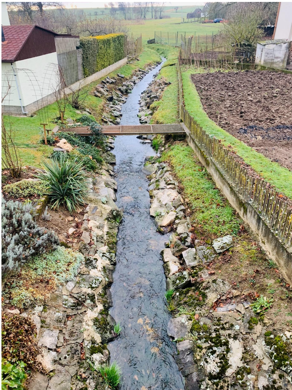
Obr. Celkový pohled na lokalitu – pohled z propustku po proudu